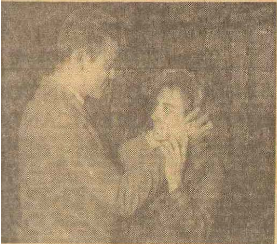
Tomé-te em minhas mãos avidas e nervosas...