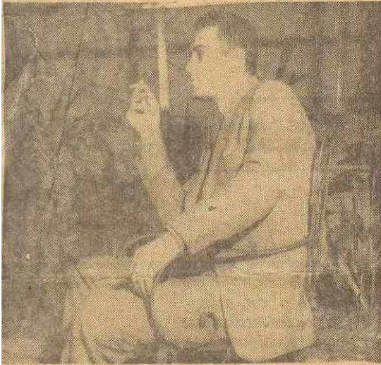
Chegaste. Em teu olhar, no primeiro momento, eu li, como num livro aberto, o sofrimento...