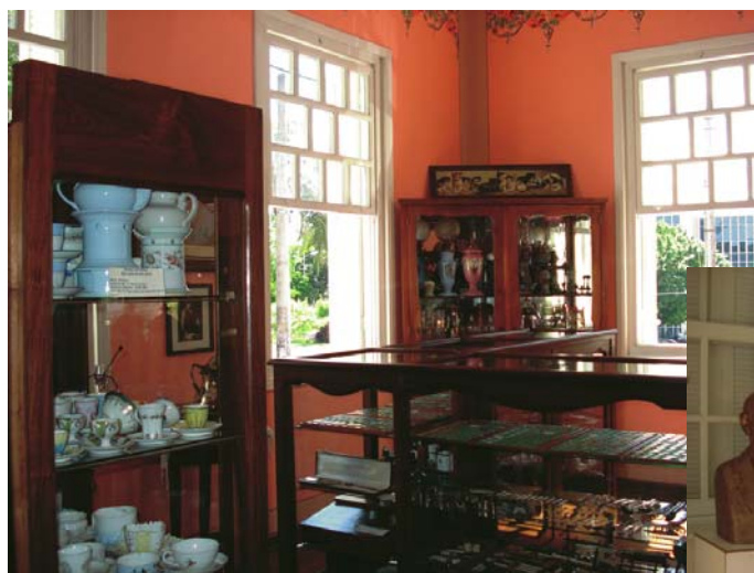
Sala Dona Tita, com louças e esculturas que compõem o rico acervo doado à prefeitura da cidade

O Museu Histórico e Pedagógico funciona de quarta à sexta-feira, das 9 às 18 horas, e aos sábados, das 14 às 18 horas. Durante a semana não fecha na hora do almoço.